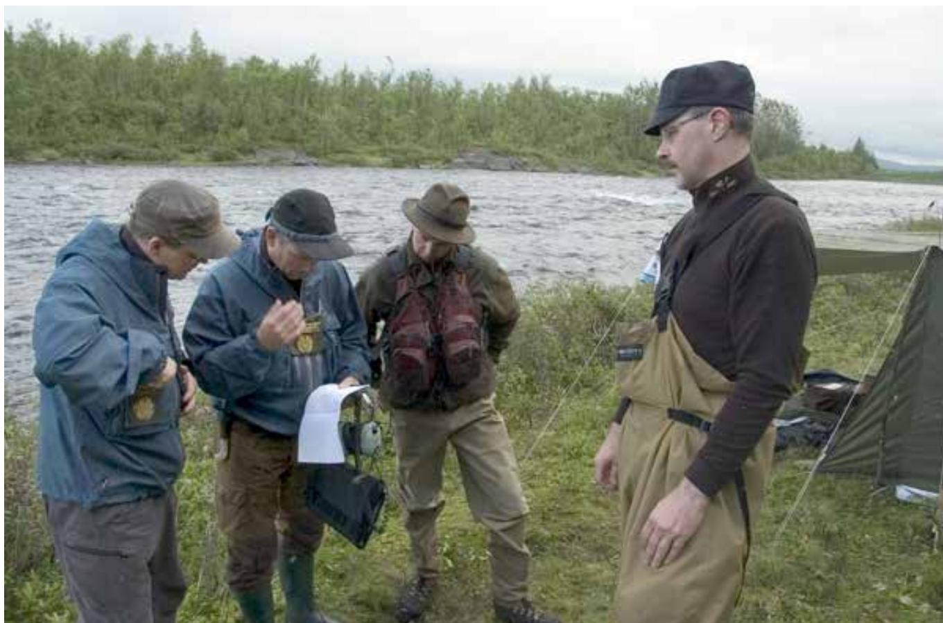
Innehavaren av ett fiskekort ska kunna identifiera sig.

överträdelser. 1 000 kronor eller 2 000 kronor har visat sig vara en ”kompromiss” som flera föreningar valt som nivå för avgiften. Även lägre nivåer förekommer, till exempel 500 kronor, hos föreningar som vill välja den ”mjuka linjen”.