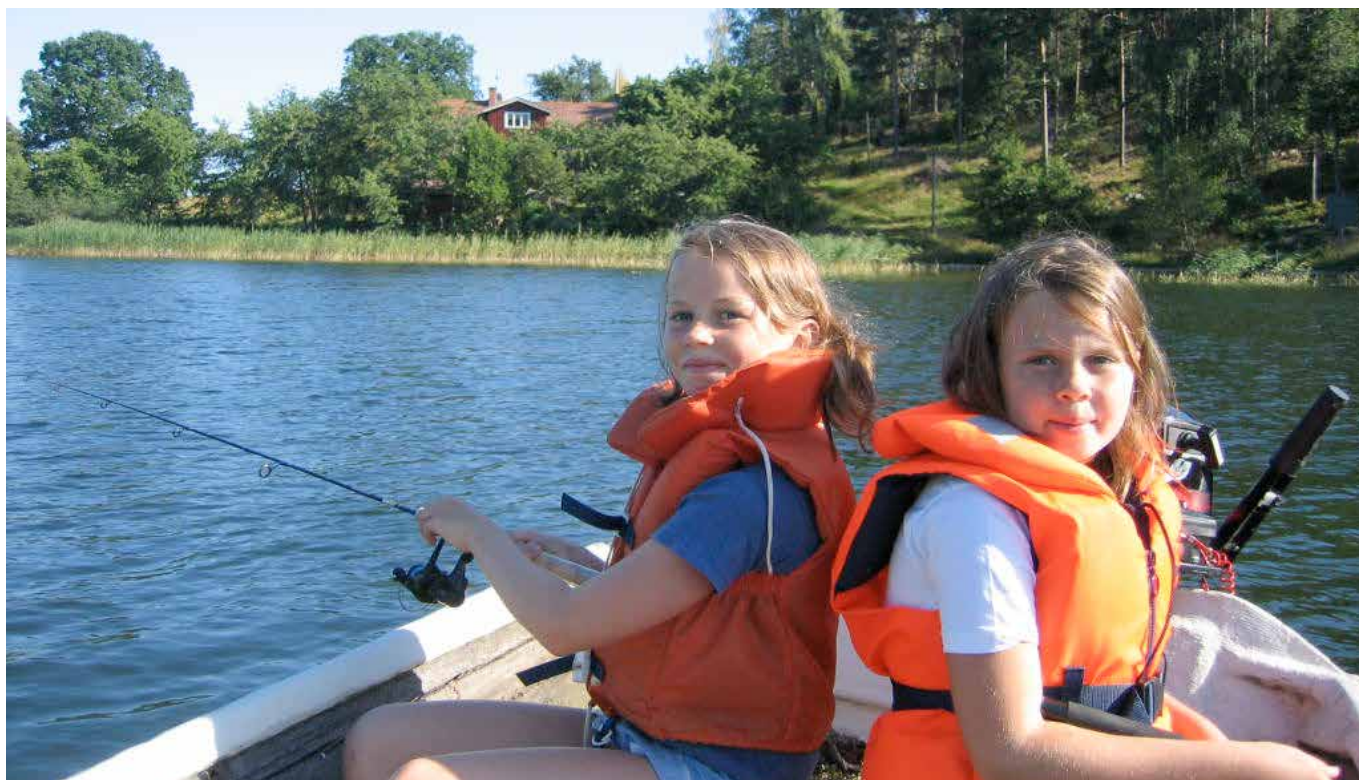
Undantag får göras om den fiskande på grund av ålder inte kunnat tillgodogöra sig informationen.

enligt stadgarna eller fiskestämman beslut gäller för fisket inom området.