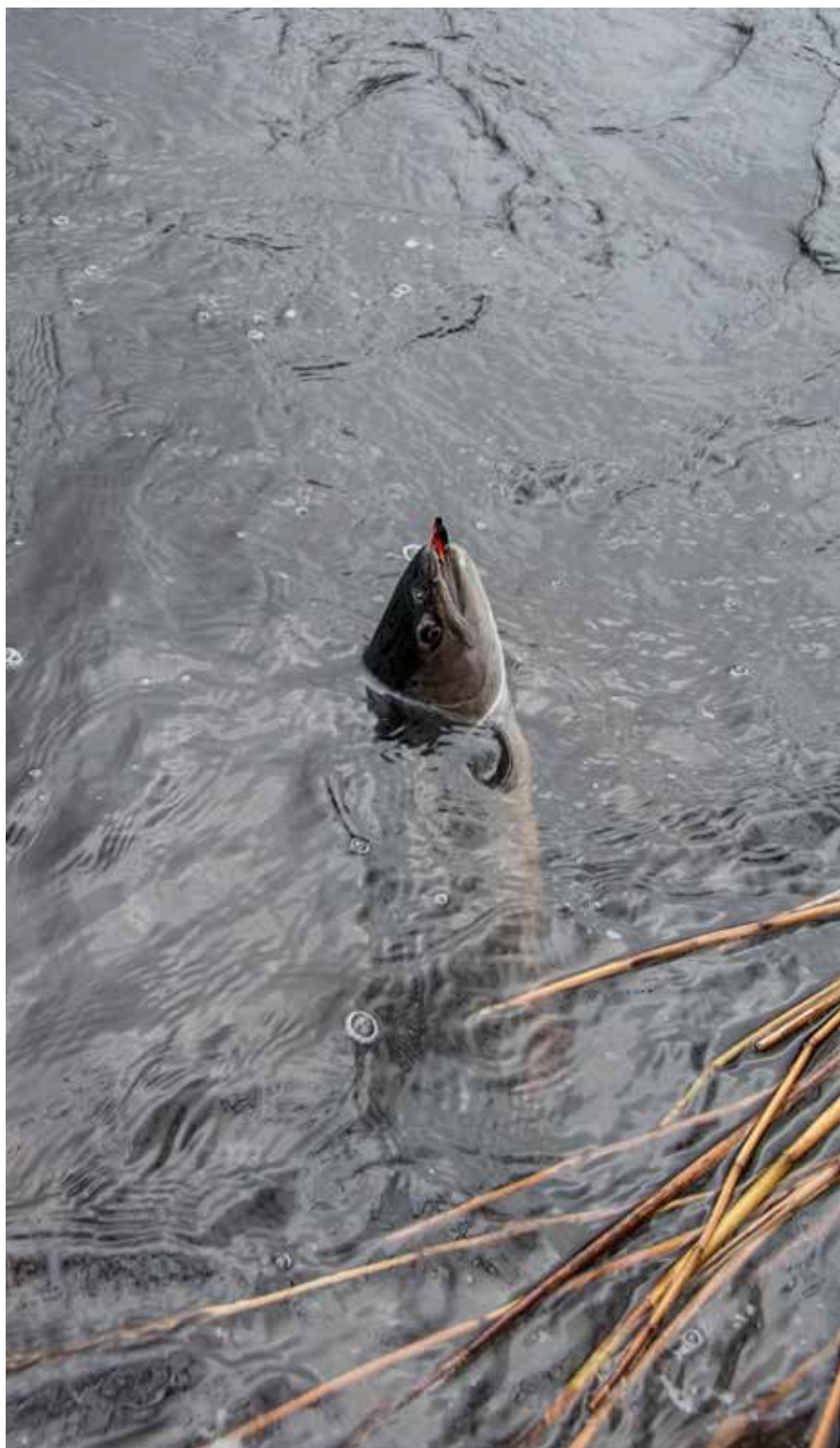
Är fisken som fångats tillåten att ta upp eller ska den sättas tillbaka?

Exempel på myndighetsföreskrifter kan vara fredningsområden i anslutning till vattenkraftverk och fiskvägar eller i vattendragens mynningsområden. Brott mot sådana föreskrifter utgör olaga fiske och ska polisanmälas. Föreningen kan utvidga ett sådant föreskrivet fredningsområde till att till exempel gälla en längre sträcka av vattendraget. Fiskare som innehar