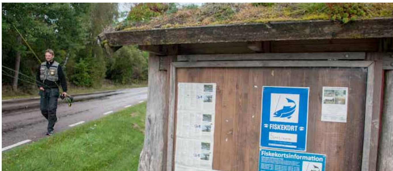
Förutom informationen direkt på fiskekortet finns strategiskt placerade anslagstavlor om fiskeregler och annan information.