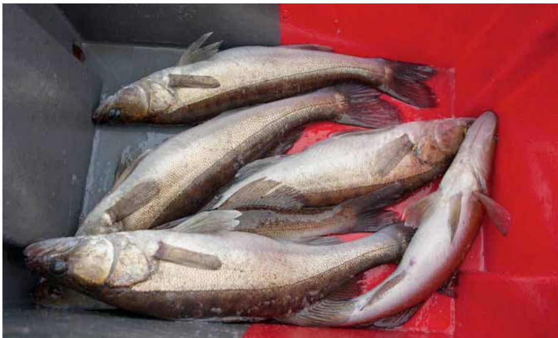
En fiskare som tar upp fler fiskar än vad fiskekortet medger har förverkat sitt fiskekort och fiskar utan lov. I det fallet kan kontrollavgiften alltså inte tillämpas.

G rundregeln för kontrollavgiften är att den som innehar fiskekort eller annat lov för visst fiske, men som bryter mot reglerna som gäller för detta fiske, kan åläggas att betala kontrollavgift. Det finns dock gränsdragningar mellan brott mot fiskelagen, och när kontrollavgift ska tillämpas, som inte är helt tydliga. I vissa fall kan rättsliga prövningar därför komma att förtydliga eller förändra följande tolkningar.