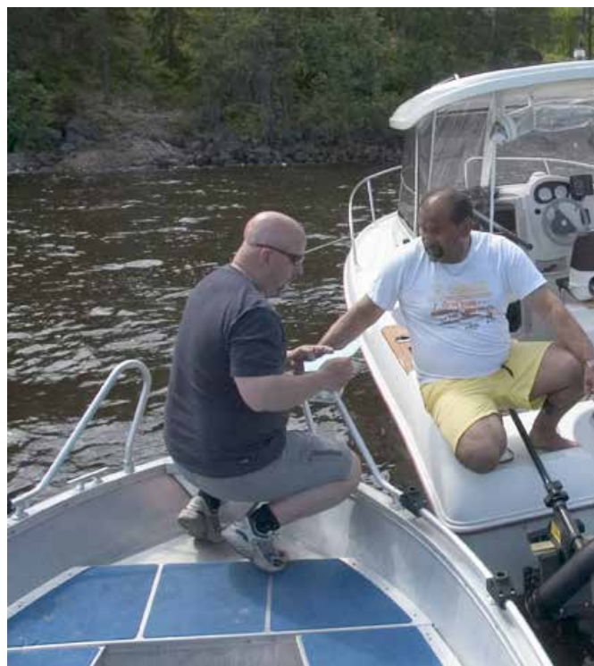
Alla viktiga uppgifter måste finnas med när fisketillsynsmannen ska utfärda en betalningsuppsmaning.

Fiskare som inte kan styrka att han eller hon innehar giltigt fiskekort fiskar olovligt.