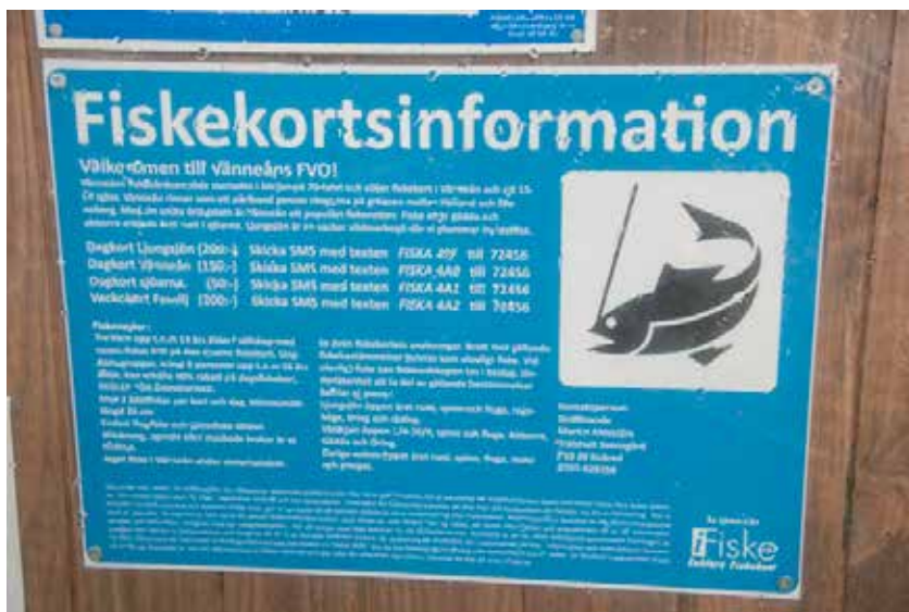
Fiskekortsköparen måste vara informerad om fiskeregler för att kontrollavgiften ska kunna tas ut.

Vid försäljning via SMS ska reglerna finnas anslagna på samma ställe där instruktionen för inköp av fiskekortet sitter. Även där ska det framgå att fiskekortsköparen är skyldig att ta del av reglerna.