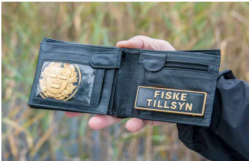
Kontrollavgiften ställer höga krav på fisketillsynsmännens kompetens.

F iskevårdsområdesföreningens fiskestämma (årsmöte) kan besluta om att införa kontrollavgiften. Beslutet ska finnas med som en särskild punkt på dagordningen. Av beslutet ska framgå vilka regler som ska omfattas av kontrollavgiften (till exempel minimimått för vissa arter), hur stor avgiften ska vara och hur föreningen ska informera fiskekortsköpare och egna medlemmar om reglerna.